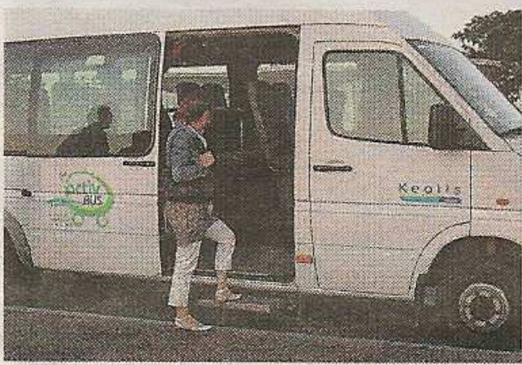
Parmi les nouveautés en matière de déplacement sur l'île de Ré : la navette salariés au départ du Belvédère.